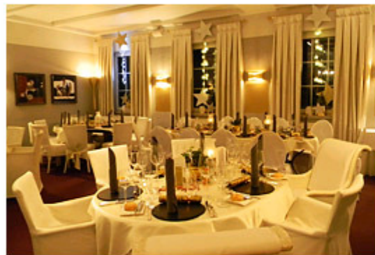
Die festliche Location im Gourmet-Restaurant

Wir bedanken uns bei all unseren Gästen für das tolle Jahr 2013 und freuen uns mit Ihnen auf ein weiteres erfolgreiches Jahr 2014.